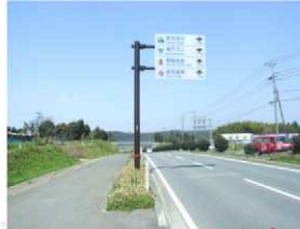
菊池地域振興局林務課発注 観光案内標識柱基礎 1基 竣工 平成22年3月