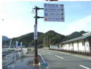
芦北地域振興局林務課発注 観光案内標識柱基礎 1基 竣工 平成22年3月