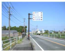
鹿本地域振興局林務課発注 観光案内標識柱基礎 1基 竣工 平成22年3月