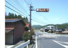
熊本県土木事務所工務課発注 標識柱基礎 3基 竣工 平成22年3月